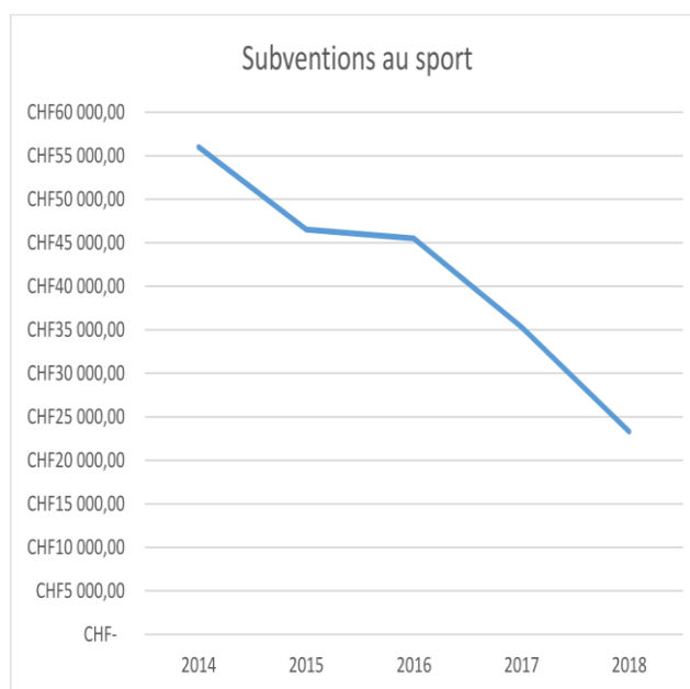
Tableau de l'évolution des subventions

Pour preuve, à la lecture de l'évolution des subventions accordées depuis 2014, les chiffres sont attristants, le soutien au sport a diminué de 58.6% et cela inclus le prix des mérites sportifs régionaux qui représente 64.3% du budget 2018. En 2018, les aides aux sports ne représentent que 5.71% du budget accordé à la culture, ce chiffre n'est certainement pas en ligne avec la population (notamment les jeunes) qui pratique du sport par rapport à la population impliquée dans la culture.