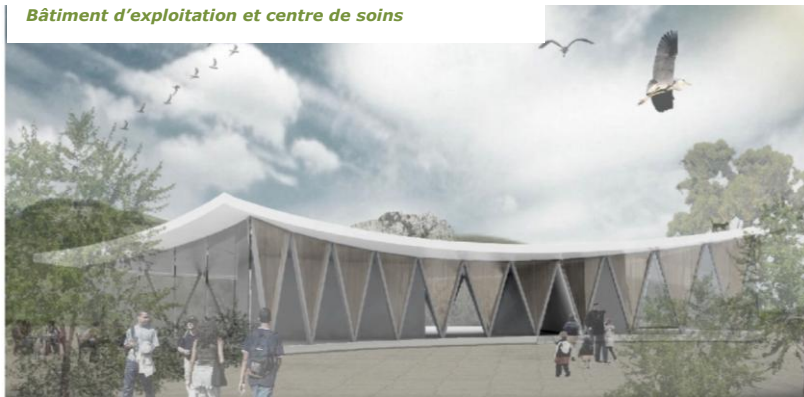
Bâtiment d'exploitation et centre de soins