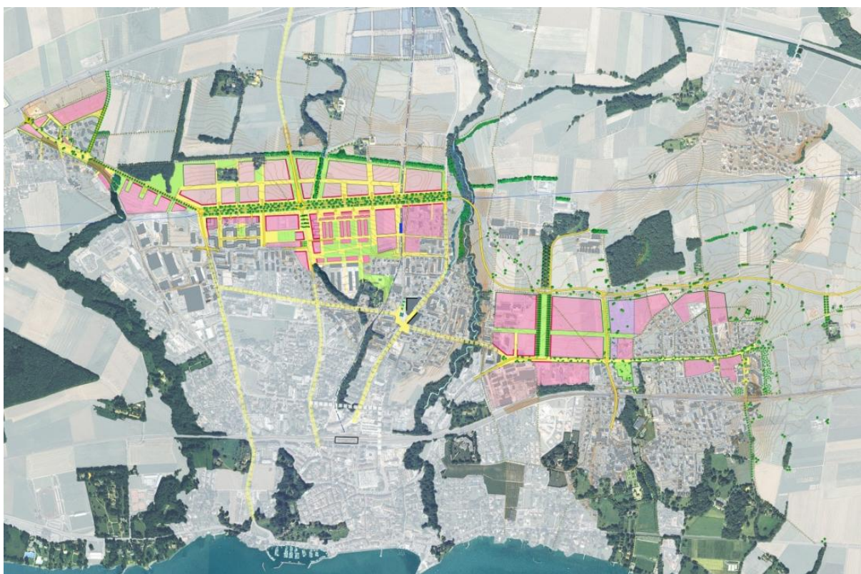
Concept du développement urbain de l'agglomération Eysins-Nyon-Prangins à l'horizon 2030

La commune d'Eysins fait partie du schéma directeur de l'agglomération nyonnaise (SDAN), adopté en 2006 par les différents partenaires 1 . Par ce document, les partenaires se sont mis d'accord sur les grands principes de développement de l'agglomération nyonnaise. Plusieurs projets spécifiques ont été identifiés dont celui du développement urbain le long de la route de distribution urbaine (RDU) qui concerne directement les communes d'Eysins, Nyon et Prangins (cf préavis n°23-06 et 56-09).