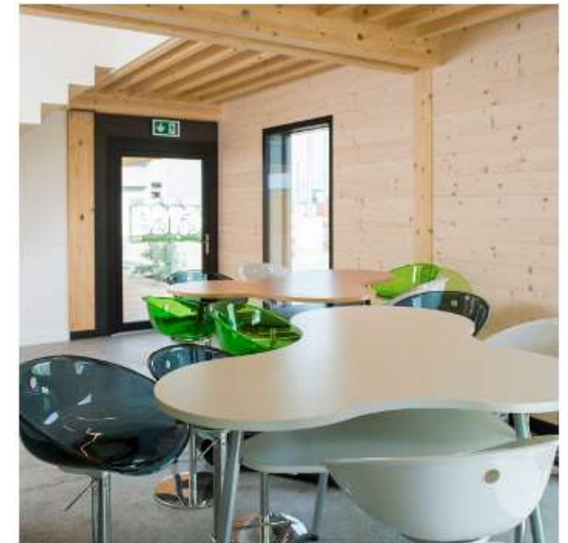
BÂTIMENT ADMINISTRATIF Gland