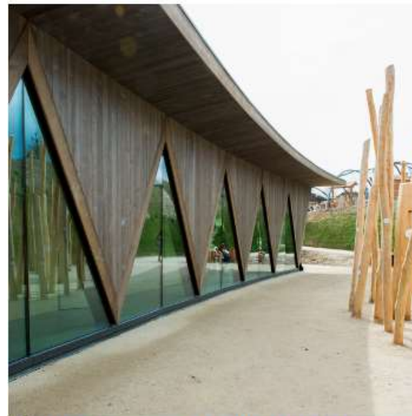
BÂTIMENT D'ACCUEIL, PARC ANIMALIER Le Vaud