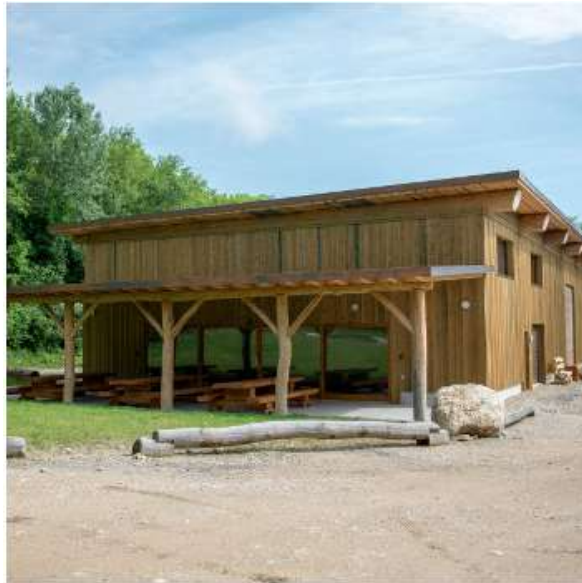
CENTRE FORESTIER Givrins