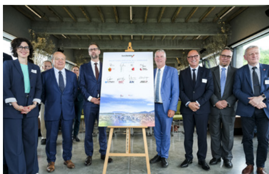
Signature du Projet d'agglomération (PA5) au Salève