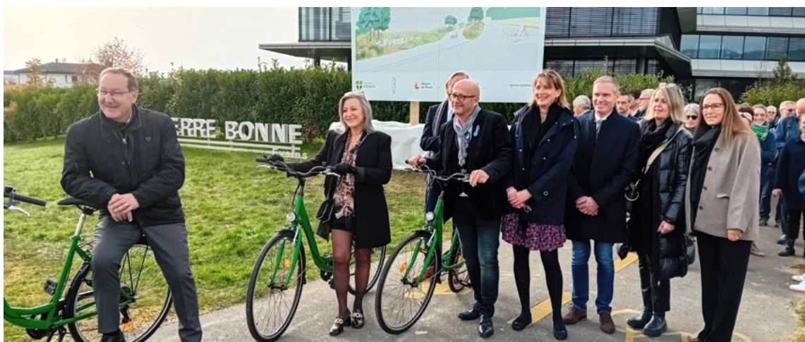
Premier coup de pioche pour la requalification de la route de Crassier à Eysins