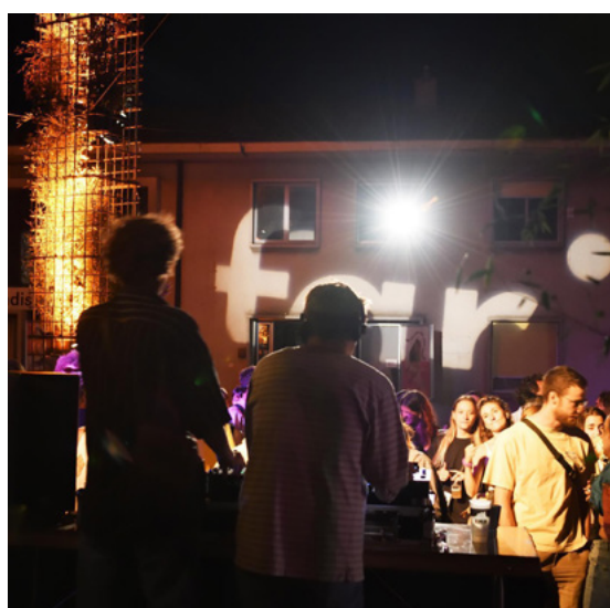
Far° Festival et fabrique des arts vivants de Nyon