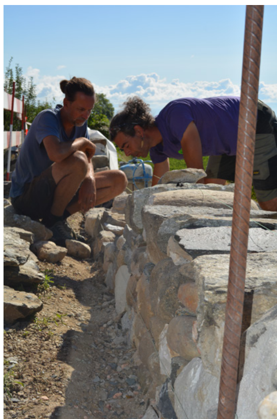
Création d'un mur en pierres sèches à Tartegnin