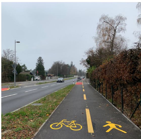
Aménagement voies cyclables et piétons entre Coppet et Nyon