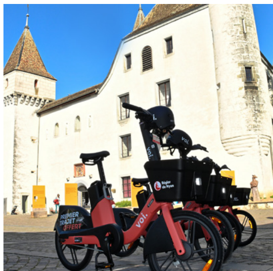
Inauguration du nouveau réseau de vélos en libre-service