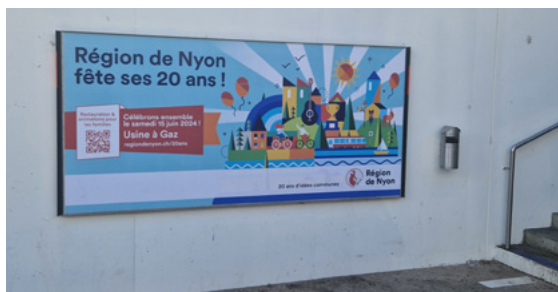
Affichage F12 pour les 20 ans de Région de Nyon