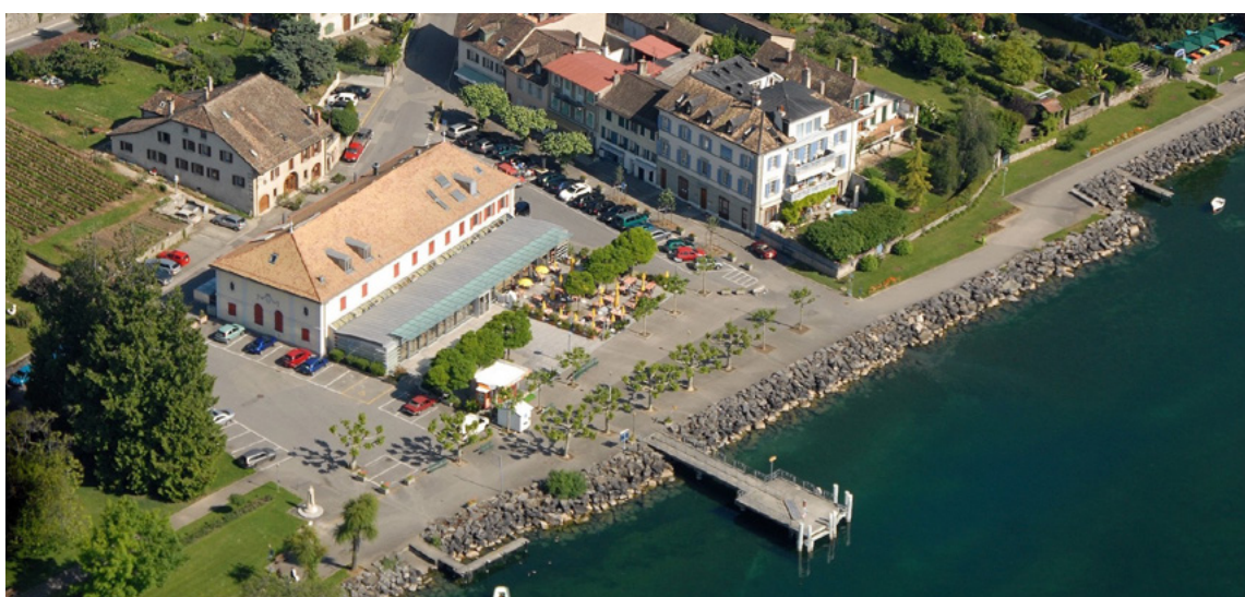
Casino Théâtre de Rolle