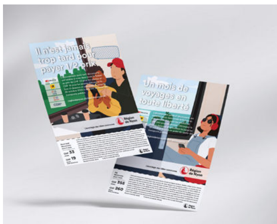
Flyers pour les abonnements découverte