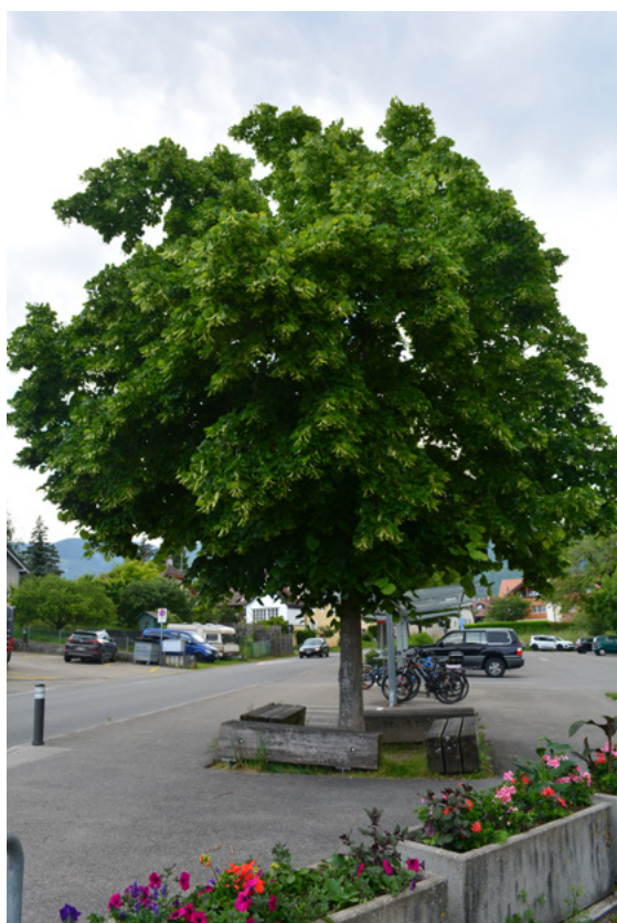
La protection des arbres fait partie des sujets traités avec les communes