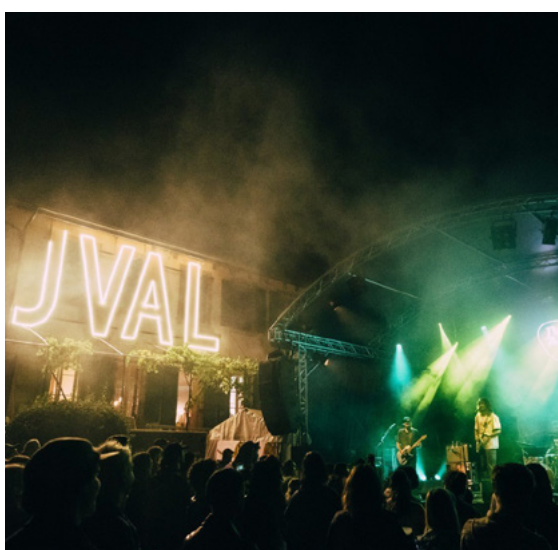
Festival JVAL Openair à Begnins