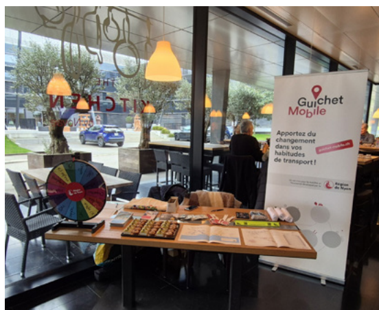
Stand Guichet Mobile à Terre Bonne, Eysins