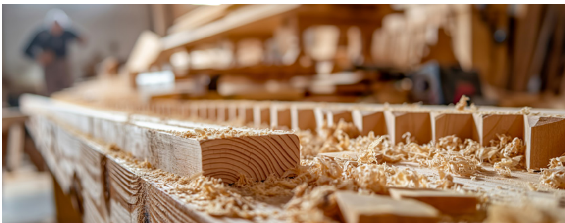
La Plateforme vaudoise du bois se mobilise pour le maintien et le développement de la première transformation du bois dans le canton de Vaud