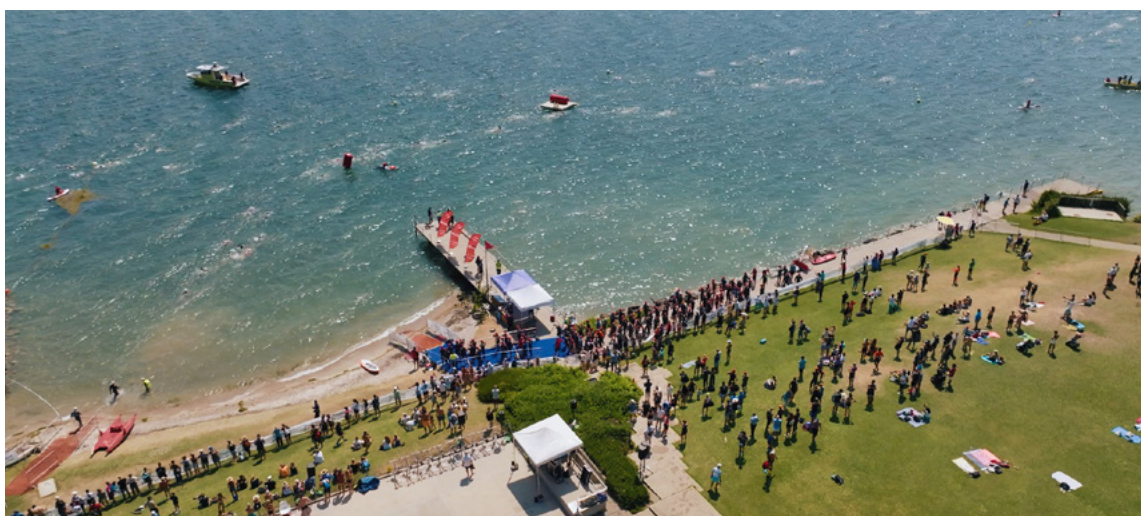
Triathlon de Nyon