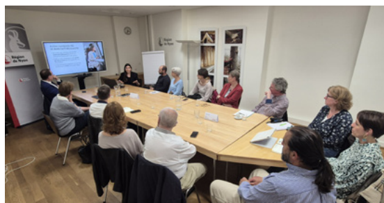
Séance marketing mobilité avec les communes