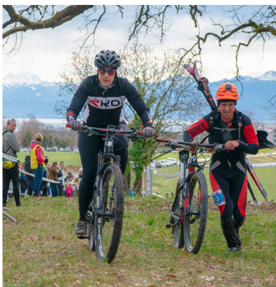
Participants au VéloP6Dôle