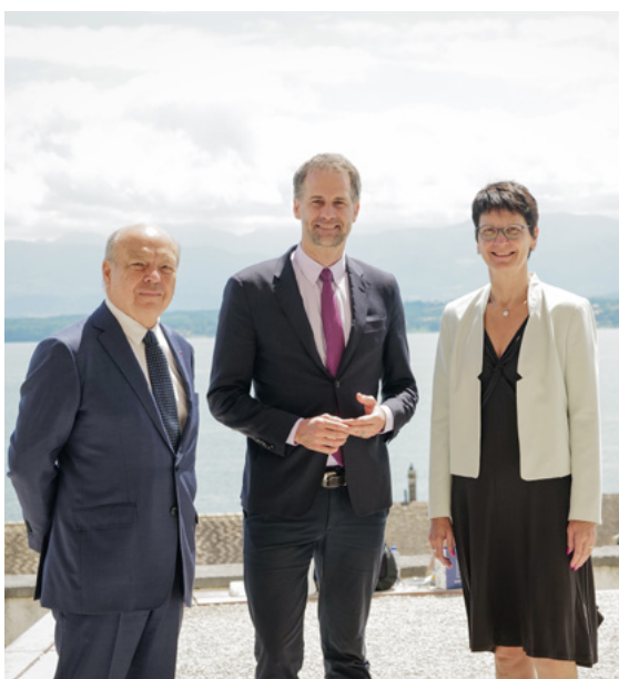
Adoption de la Vision territoriale transfrontalière (VTT)