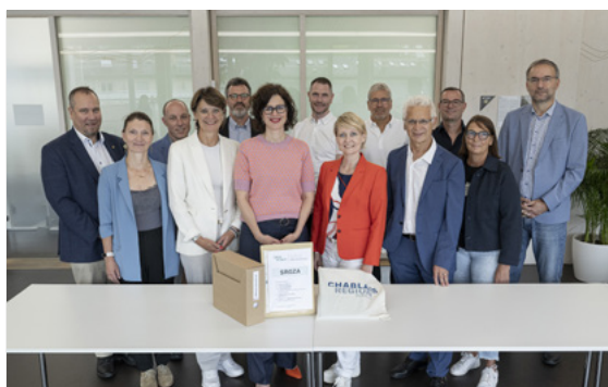
Dépôt de la Stratégie régionale de gestion des zones d'activités (SRGZA) auprès du Conseil d'Etat