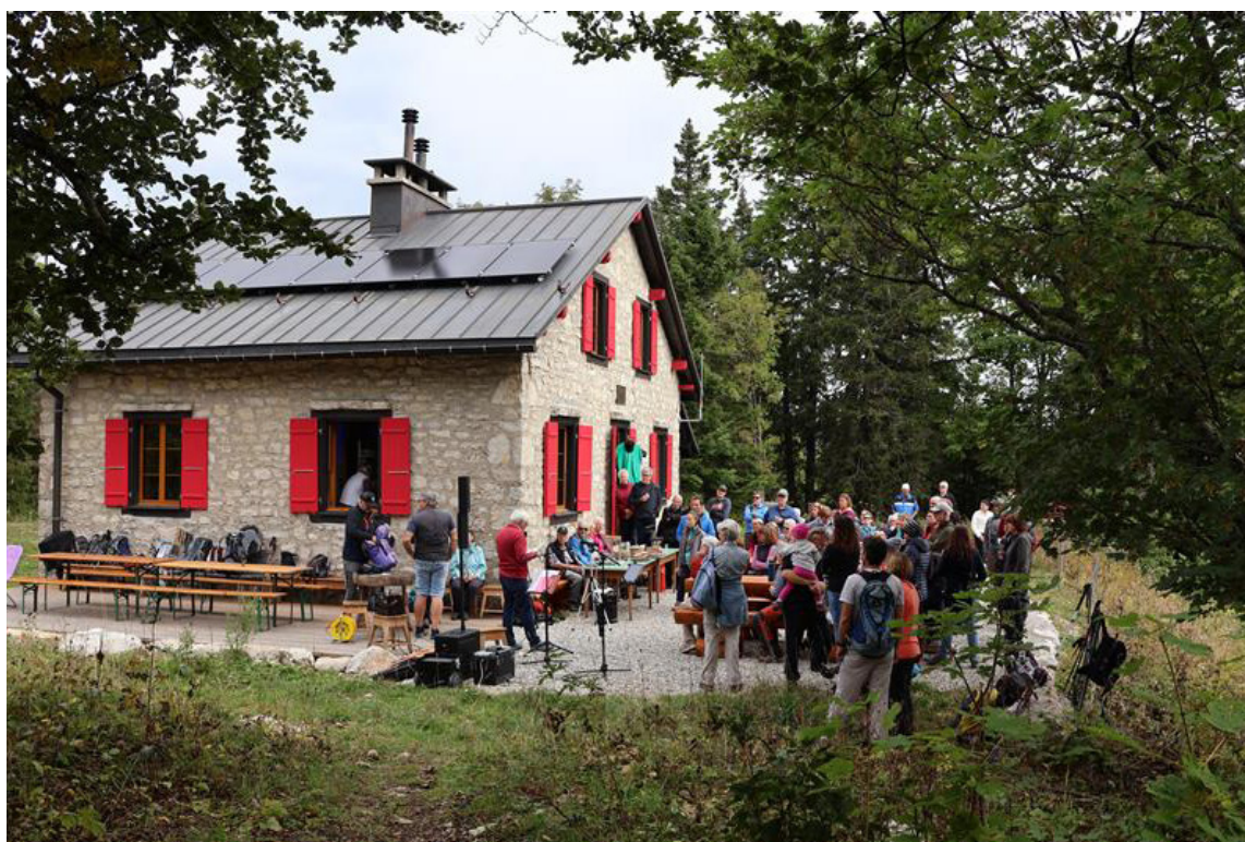
Cabane du Carroz sur la commune d'Arzier-Le Muids