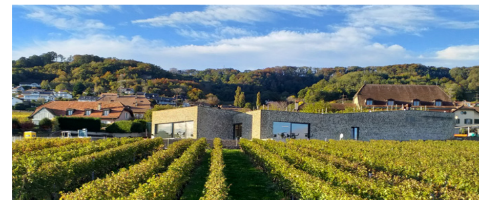
Maison des Vins de La Côte, à Mont-sur-Rolle

La taxe est due dans son entier dès lors qu'un·e propriétaire est inscrit·e dans la commune au 1 er janvier de l'année de référence.