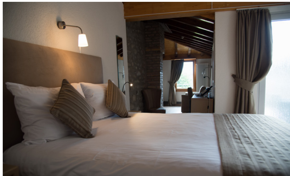
Hôtel de l'Ange à Nyon