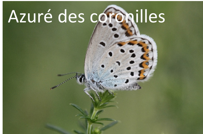
Azuré des coronilles