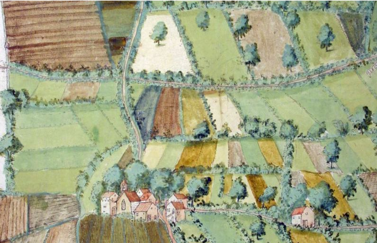
Un village de la Côte en 1540